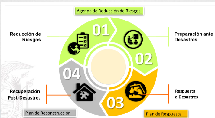
Gráfico 1: Herramientas para la planificación de la gestión de riesgos a nivel local