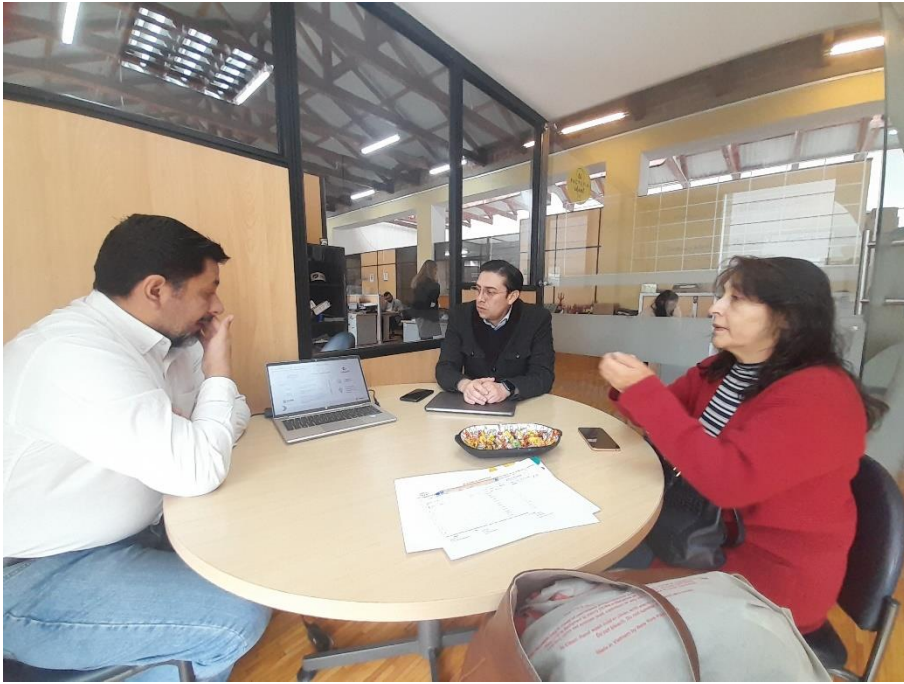
Reunión técnica con la Secretaría de Desarrollo Productivo y CONQUITO