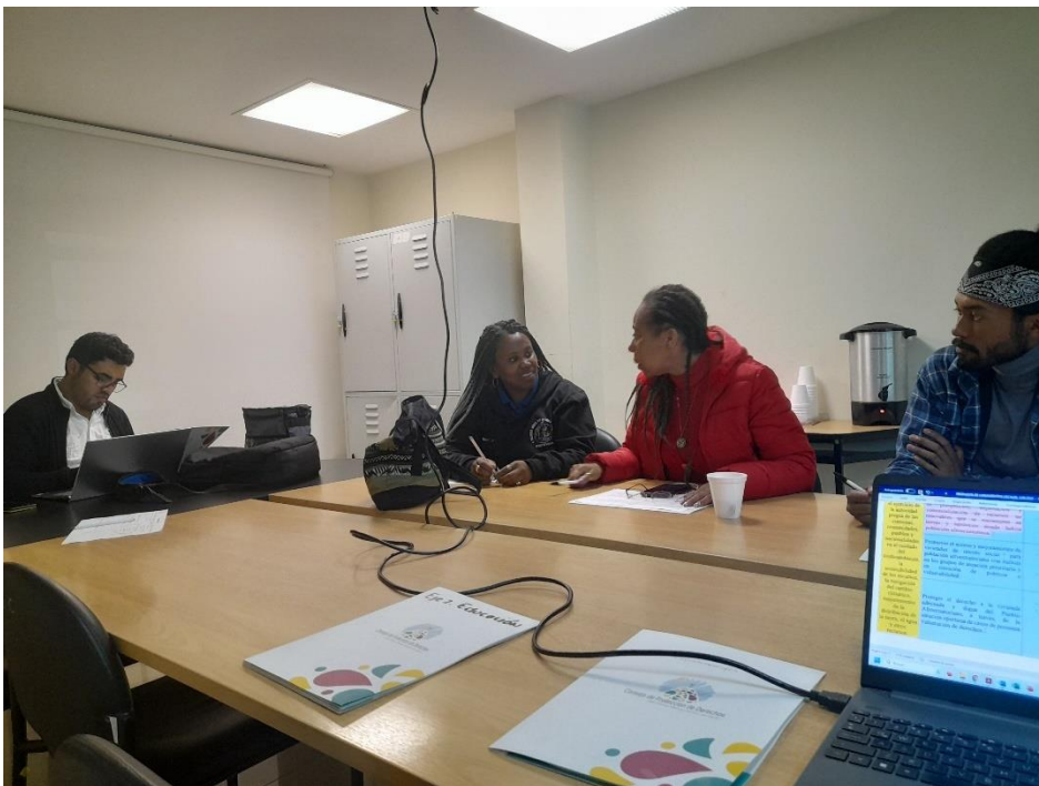
Taller con representantes del CCD del Pueblo Afrodescendiente y Montubio