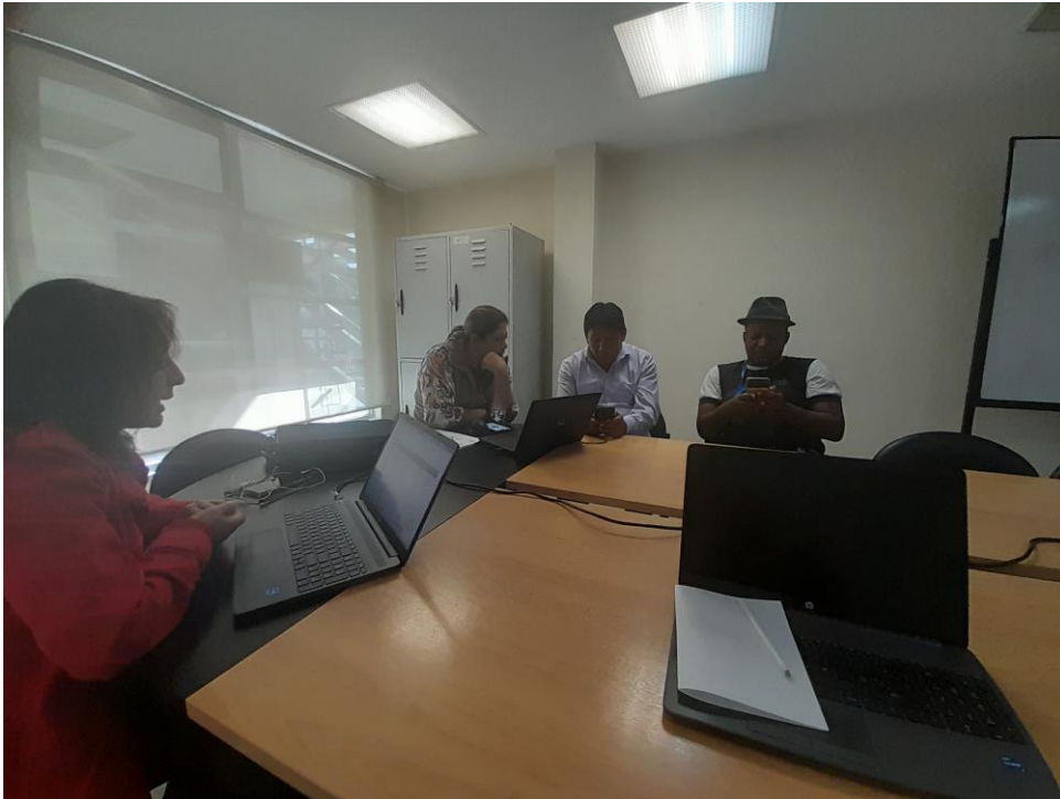
Reunión técnica con el equipo de la DPE