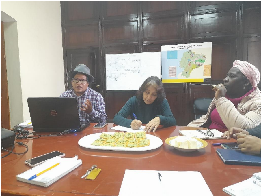
Reunión con representantes del CNIPYN