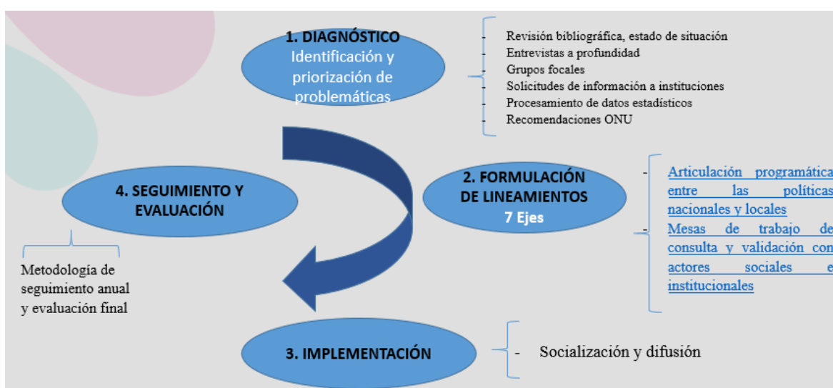
Cuadro No. 1. Técnicas de investigación implementadas en cada fase del ciclo de políticas públicas