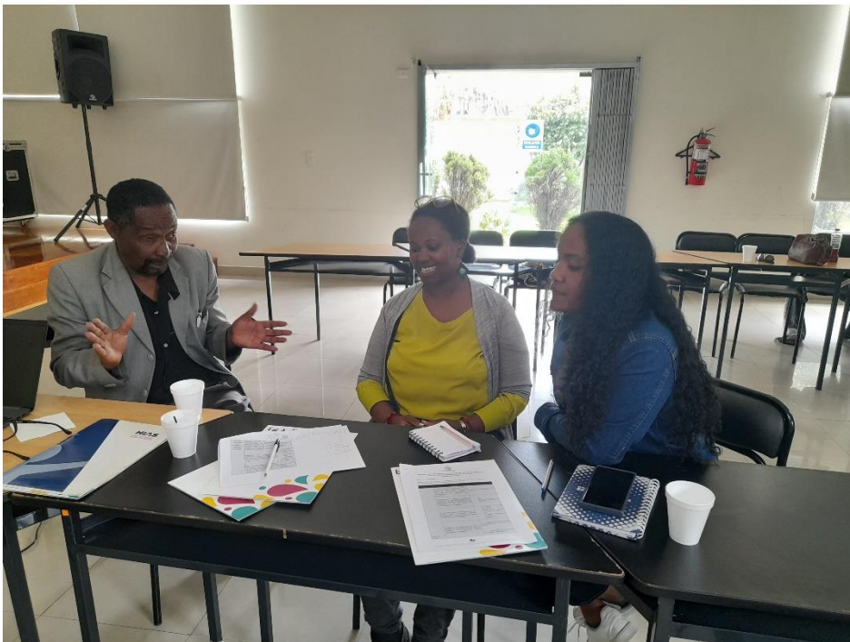
Mesas de trabajo con representantes de FOGNEP y CONAMUNE