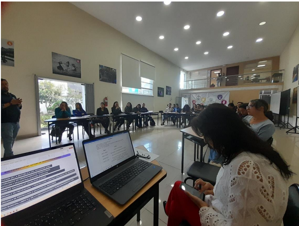
Taller con actores institucionales