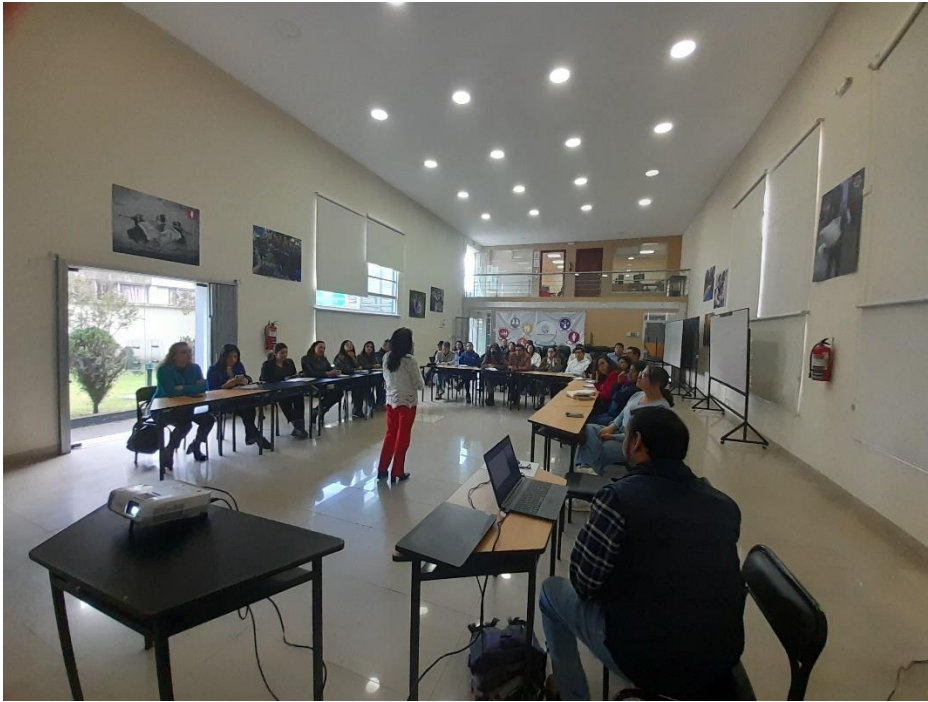
Taller con actores institucionales