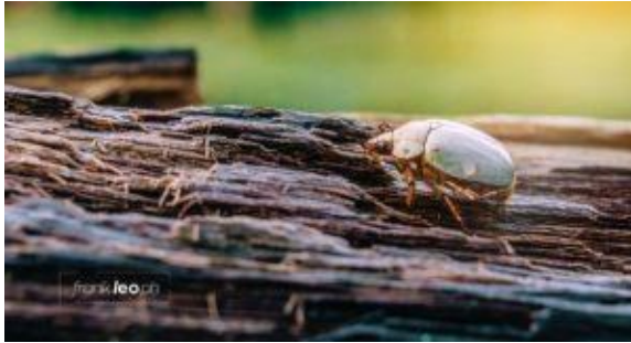
Por Frank Leo Ph