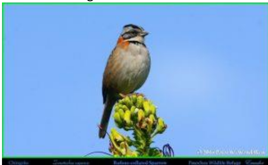
Gorrión o chingolo