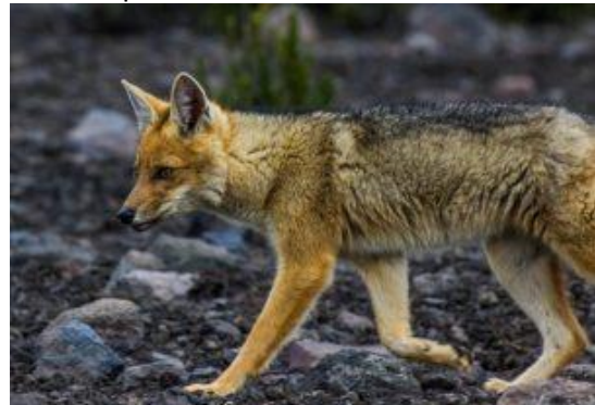
Lobo de páramo