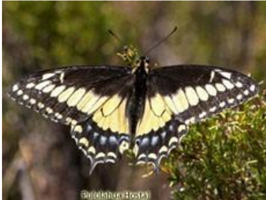
Por Pululahua Hostal

Mariposa papilio polyxenes y ascia monustes