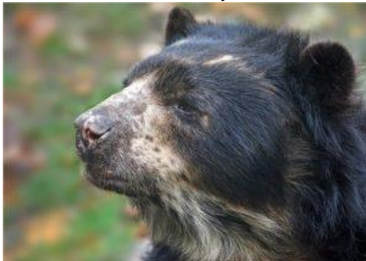
Oso andino u oso de anteojos

Con el objetivo de fortalecer la protección de estas especies, el Concejo Metropolitano en el año 2012, declaró a estas 13 especies como fauna emblemática del Distrito Metropolitano de Quito: