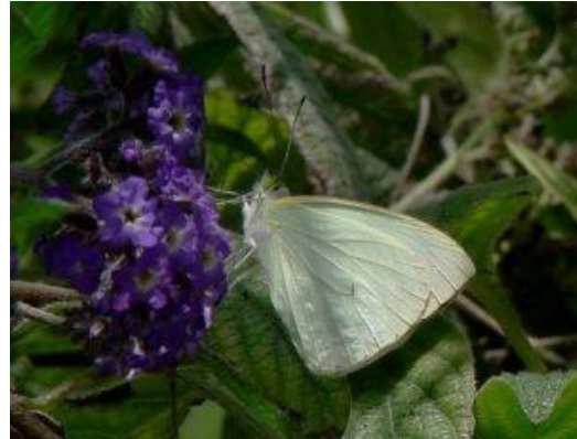
Por Shirley Sekarajasingham

Es responsabilidad de todos los niveles de gobierno implementar políticas ambientales para garantizar la vida de estas especies y su entorno. Pero también es parte de la corresponsabilidad ciudadana transformar las lógicas de consumo que amenazan la biodiversidad, y ejercer un rol de vigilancia y veeduría frente a las acciones públicas y privadas que buscan la explotación de bienes naturales perjudicando el equilibrio de estos ecosistemas.