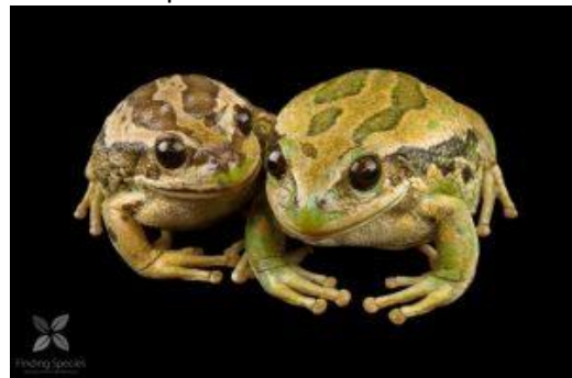
Rana marsupial andina