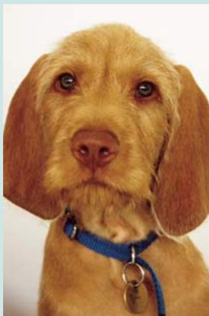
ARRIBA:Vizsla Húngaro pelo de alambre