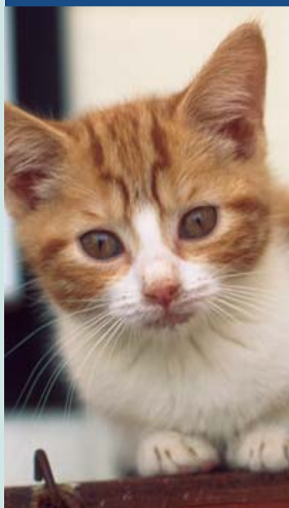
ABAJO:Gatito en el centro para animales de la RSPCA