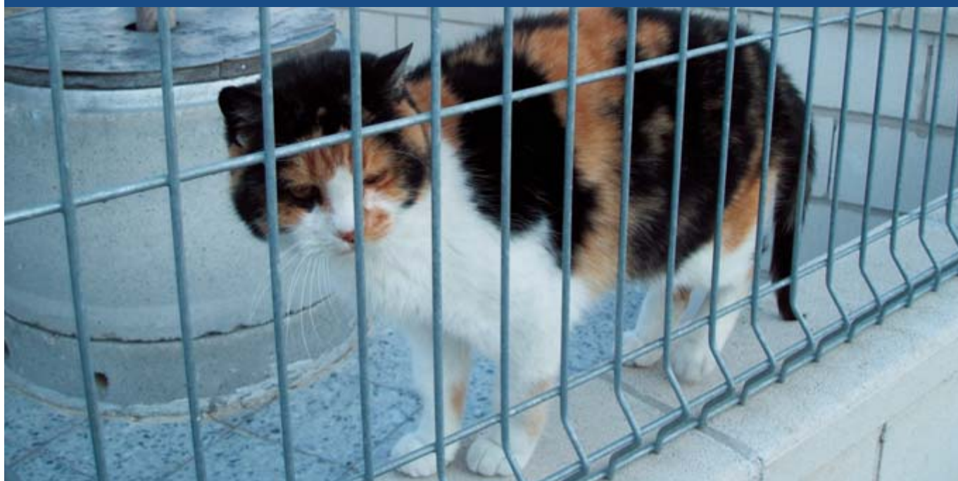
Recinto para gatos en albergue de Madrid